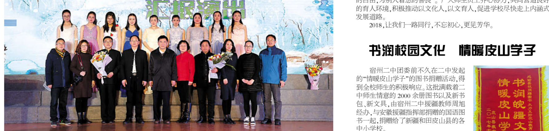
1月7日,我校2018届音乐班举行“冬之旅”汇报演出,图为校领导及相关负责同志、特邀校友、音乐班师生合影。(图文材料将在下期校报艺术天地专版刊出)