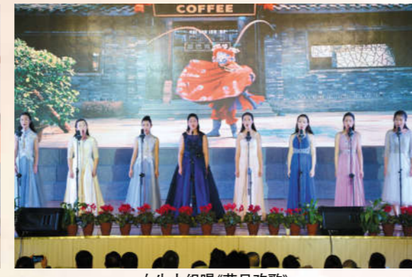
女生小组唱《节日欢歌》 表演者 高三音乐班全体同学