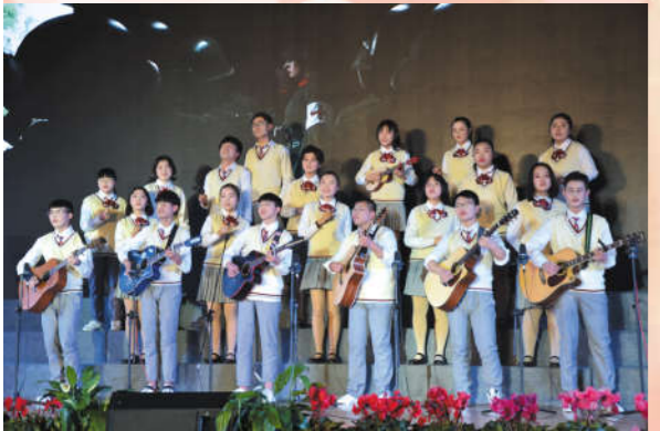
校园歌曲组合《光明的故事》 表演者 音乐社团