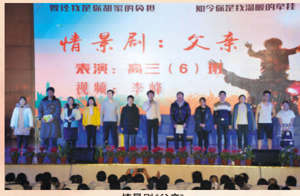
情景剧《父亲》 表演者:高三(6)班学生