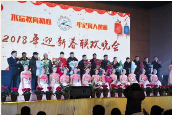
洒汗育桃李,教坛展风采。向从教30年的老师献花,校领导、学生和老教师合影。

党的十九届二中全会突出亮点 坚持习近平新时代中国特色社会主义思想。全会强调,习近平新时代中国特色社会主义思想是马克思主义中国化最新成果,是当代中国马克思主义、21世纪马克思主义,是党和国家必须长期坚持的指导思想。 坚持和加强党对一切工作的领导。中国共产党领导是中国特色社会主义最本质的特征,是中国特色社会主义制度最大的优势,必须长期坚持和加强党对一切工作的领导。 五位一体、五大发展理念和奋斗目标。经济建设、政治建设、文化建设、社会建设、生态文明建设“五位一体”总体布局,创新、协调、绿色、开放、共享的新发展理念,到2020年全面建成小康社会、到2035年基本实现社会主义现代化、到本世纪中叶建成社会主义现代化强国的奋斗目标,实现中华民族伟大复兴,对激励和引导全党全国各族人民团结奋斗具有重大引领作用。 构建人类命运共同体。坚持和平发展道路,坚持互利共赢开放战略,推动构建人类命运共同体,促进人类和平发展的崇高事业具有重大意义。 国家监察体制改革。国家监察体制改革是事关全局的重大政治体制改革,是强化党和国家自我监督的重大决策部署,要依法建立党统一领导的反腐败工作机构,构建集中统一、权威高效的国家监察体系,实现对所有行使公权力的公职人员监察全覆盖。 宪法是国家各项制度和法律法规的总依据,完善宪法的制度规定,对完善和发展中国特色社会主义制度具有重要作用。